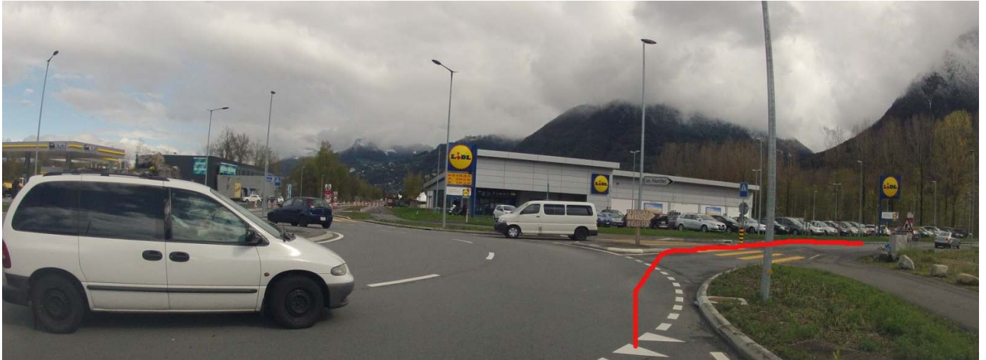
Parking le long de la route, côté arbre